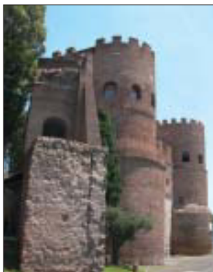
Porta San Paolo